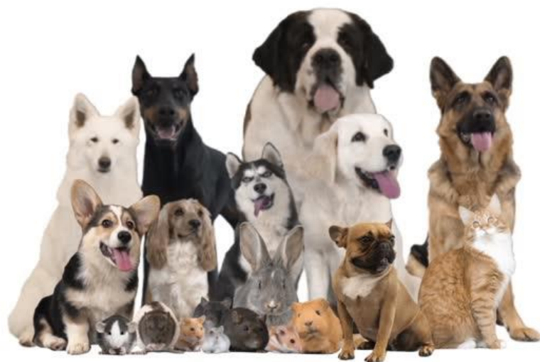
De fidèles compagnons pour la zoothérapie